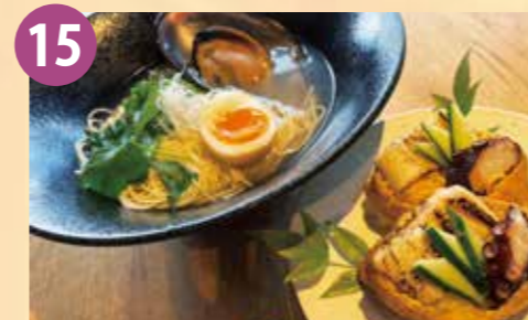
15 セトノウツツ ゆ糸ゆ糸 瀬戸貝ラーメン~華いなり寿司付き~ 税込 1,700円 Google Map→

鮮度の良い魚介類を酢飯の上に盛り合わせた店主おすすめの名物海鮮丼。※写真は上3,300円(税込)