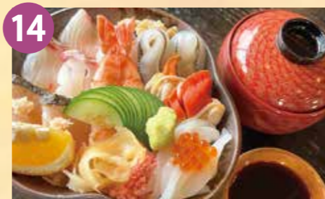
14 かわい寿し かわい寿しの名物海鮮丼 税込 2,420円~ Google Map→

道の駅の裏手にある、干潟時に道が現れる「真宮島(しんぐうじま)」をモチーフにしたご当地カレーです。