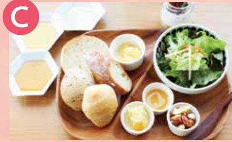
C KASAHARA HONEY はちみつ食べ比べランチ 税込 1,650円 Google Map→

周防大島で採蜜した「みかん蜂蜜」を含む4種のはちみつを食べ比べできる贅沢セット。サラダ・ヨーグルト付き。