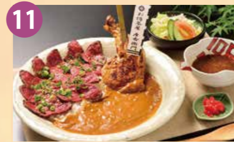
11 お侍茶屋 彦右衛門 大島本店 男飯カレー 税込 1,900円 Google Map→

ハワイの伝統料理のカルアビッグ、ガーリックシュリンプ、もち粉チキンが一皿で味わえるお得なプレートです!