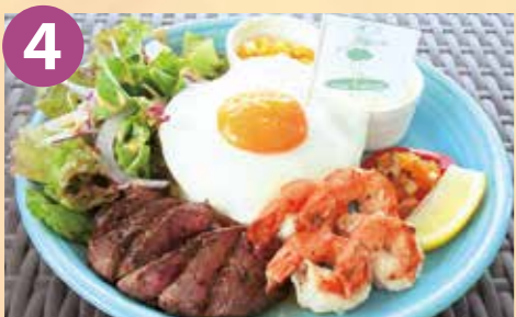
4 ANCHOR(アンカー) ステーキガーリックシュリンププレート 税込 1,800円 Google Map→

周防大島を食べ尽くせ! 二次元バーコードでお店の場所を グーグルマップで検索できます!