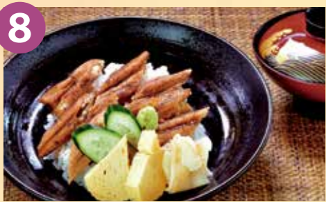
8 鮭くぼ田 特選穴子丼 税込 2,100円 Google Map→

選りすぐりの穴子を丁寧に下処理し、時間をかけてフワフワに煮上げた穴子を2匹分使った店主自慢の1杯。