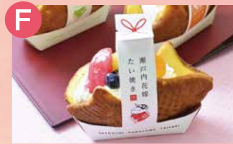
F 瀬戸内花嫁たい焼(お侍茶屋 彦右衛門) フルーツ花嫁たい焼き 税込 480円~ Google Map→

シャインマスカットを贅沢に使用したパフェです。季節に合わせた旬のフルーツを使用したスイーツをお楽しみください。