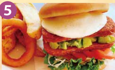
5 グリーンスティながうら スパムとアボカドのハワイアンバーガー (フライドポテト・サラダ付) 税込 1,200円 Google Map→

ハラミステーキとハワイアンガーリックシュリンプの黄金コンビ。やわらかハラミとプリプリのガーリックシュリンプがたまらない!!