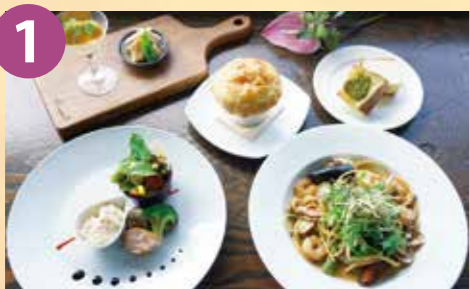
1 グランカフェシーブリーズ1976 パスタコース「オペラ」 税込 2,980円~ Google Map→

大人気「あおき醤油のクリームパスタ」をメインにスープやエスカベッシュ、デザートまで付く大満足!大満腹のパスタコースをご賞味ください!