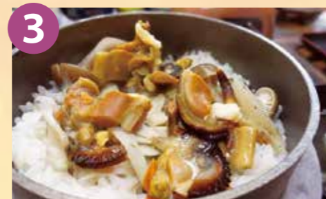
3 食在周防あらかわ 瀬戸貝の釜飯御膳 税込 1,760円 Google Map→

8種類の出汁からお好きな味を2種類お選びいただき、豚コース、牛豚コース、お肉のグレードもお好みで満腹・満足にランチを楽しんでください。※写真は2,280円(税込)