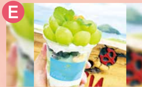
E 瀬戸内ジャズガーデン マスカットのブーケカフェ (期間限定) 税込 1,500円 Google Map→

ガツンと旨いチキン&ビーフカレーに千鳥足とレアステーキをトッピングしたお侍茶屋彦右衛門名物の男飯カレーをご賞味あれ!