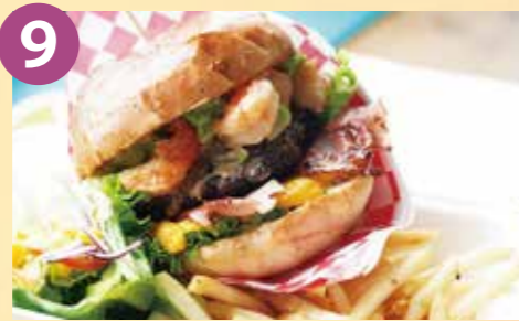
9 Power Beach アボカドシュリンプバーガー (ポテト、サラダ、マカロニセット) 税込 1,940円 Google Map→

選りすぐりの穴子を丁寧に下処理し、時間をかけてフワフワに煮上げた穴子を2匹分使った店主自慢の1杯。