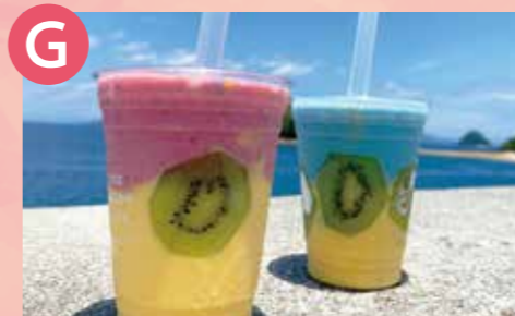
G ザ・ワゴン・カフェ アートスムージー 税込 940円 Google Map→

地物の魚のアラ、干し海老、貝柱、瀬戸貝の魚介スープに特注の細麺を合わせました。これぞ「島ラーメン」!!和食職人の創作いなり寿司付き。