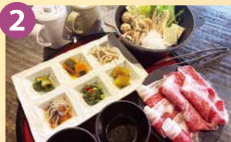
2 大島本陣茶屋 まんぷく鍋とカレー食べ放題 税込 1,200円~ Google Map→

大人気「あおき醤油のクリームパスタ」をメインにスープやエスカベッシュ、デザートまで付く大満足!大満腹のパスタコースをご賞味ください!