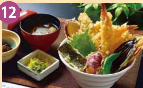
12 竜崎温泉ちどり 幸せの巖門天丼 税込 1,300円 Google Map→

たい焼き生地をワッフルに角隠しに見立てた生クリームと季節のフルーツをかんざしの様に盛りつけた瀬戸内の和スイーツです。