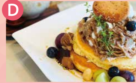
D café Misaki 秋のフルーツたっぷり パンケーキ 税込 1,480円 Google Map→

周防大島で採蜜した「みかん蜂蜜」を含む4種のはちみつを食べ比べできる贅沢セット。サラダ・ヨーグルト付き。