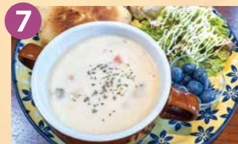
7 Café&Bar ESSENCE たっぷりクラムチャウダーと フォカッチャ 税込 850円 Google Map→

サフランライスに、ポークカツレツ、ナポリタンがセットになった「アロハラライス」(ポーク)と、ガーリックライスにロースステーキ、ミートソースパスタがセットになった「アロハラライス」(ビーフ)は、もちろんテイクアウトもOK!