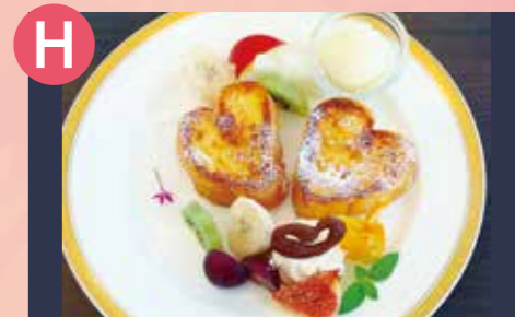
H 海カフェ Cachette(カシェット) パリふわフレンチトースト 税込 1,150円 Google Map→

道の駅サザンセットとうわで営業中のオシャレなキッチンカー。果物と野菜から作るスムージーは見た目もカラフルで体だけでなく心もハッピーにしてくれます!