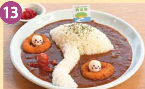
13 道の駅サザンセットとうわ 真宮島カレー 税込 800円 Google Map→

しあわせ折岩のひとつ「巖門」をイメージした名物の巖門天丼は瀬戸内の小魚の天ぷらや大海老の天ぷらを盛り込んだ豪快天丼です。