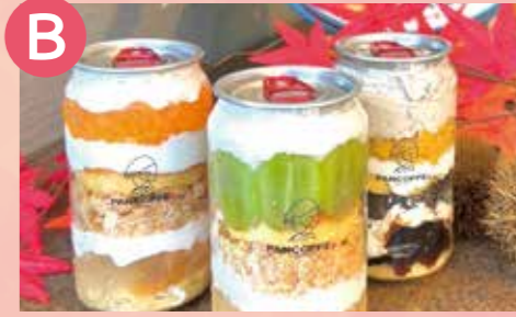
B パンコッペ周防大島店 季節のシーリングケーキ 税込 900円 Google Map→

かわいいクマさんクリームソーダに豪華な2段ケーキセットと大島瀬戸の絶景ロケーションで心地よい映え時間をお過ごしください。+480円で、くまさんソーダ。