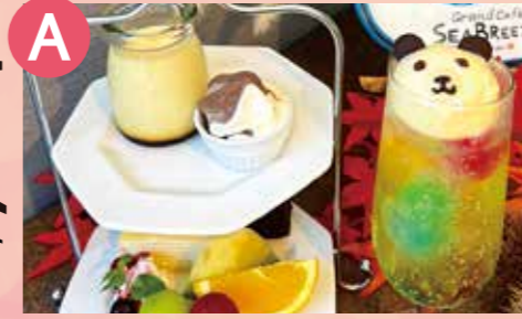
A グランカフェシーブリーズ1976 クマさんと2段ケーキセット 税込 1,100円 Google Map→

魚介とあさりの旨味、ほくほく野菜の入った温かいスープと、ふんわり食感のパン「フォカッチャ」のランチセットです。