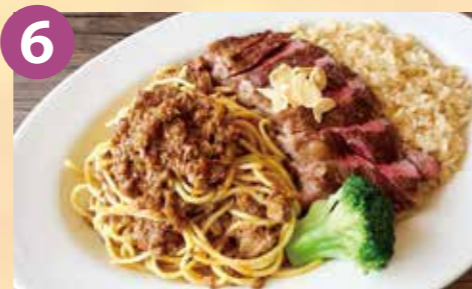
6 アロハオレンジ 2nd アロハラライス(平日限定) 税込 1,300円 Google Map→

ハワイで人気のスパムにテリヤキソースを絡めて目玉焼、千切りキャベツ、トマトとマヨネーズで和えたアボカドをたっぷり乗せたバーガーです。(期間限定)