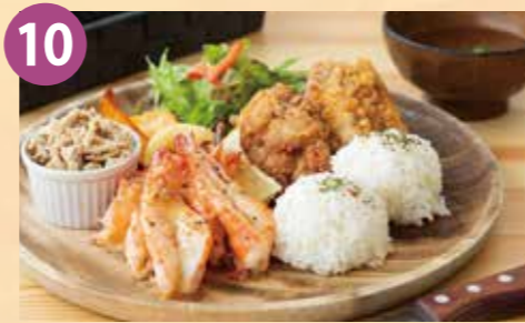
10 アロハオレンジ ハワイアンセット 税込 2,000円 Google Map→

プリプリの海老と牛100%の手づくりパテのバーガーです。たくさんのポテトとサラダも付いてボリューム満点の一品です。